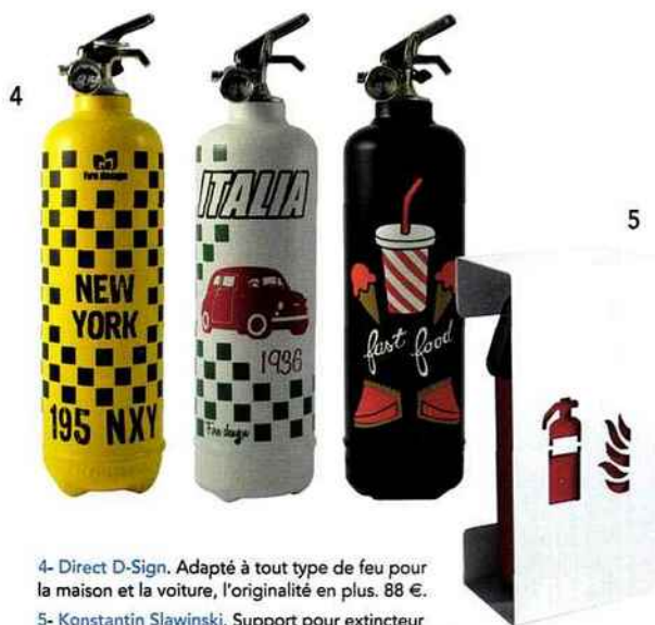
4- Direct D-Sign. Adapté à tout type de feu pour la maison et la voiture, l'originalité en plus. 88 €.