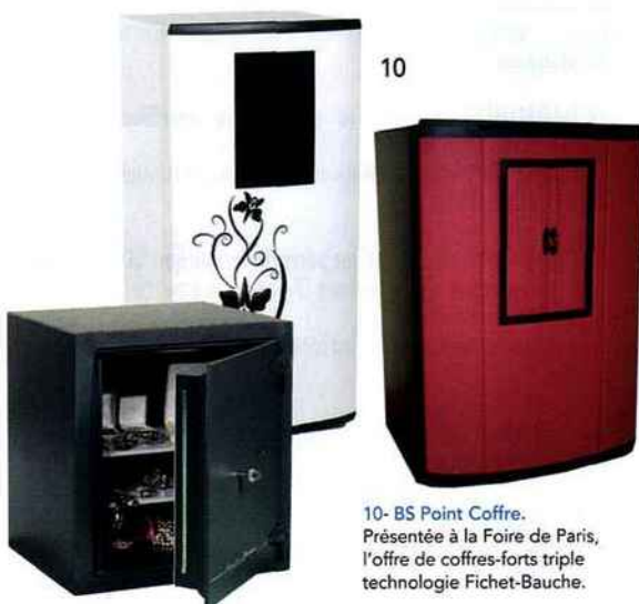
10- BS Point Coffre. Présentée à la Foire de Paris, l'offre de coffres-forts triple technologie Fichet-Bauche.